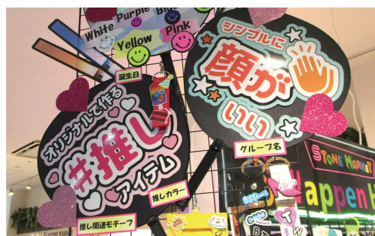
他の素材と組み合わせ! うちわPOP