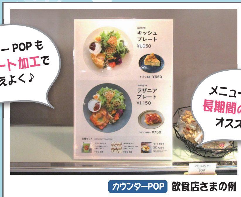
カウンターPOP 飲食店さまの例