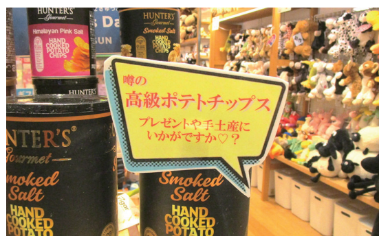
はさみで切り抜き 立体感