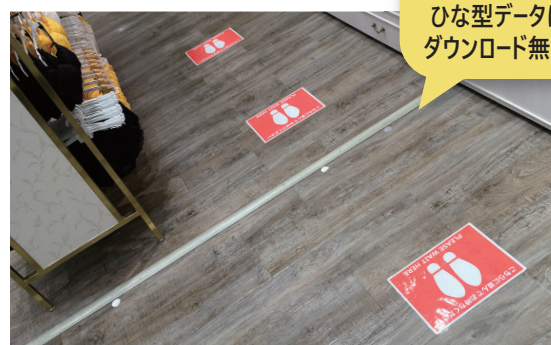
床に貼ってもOK! 足跡POP