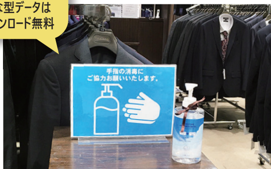
POPスタンドに ラミネートで自立しやすく