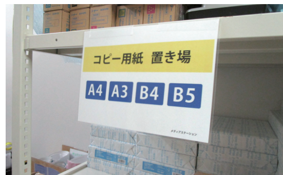
バックヤードに 整理整頓 / 長期の掲示に